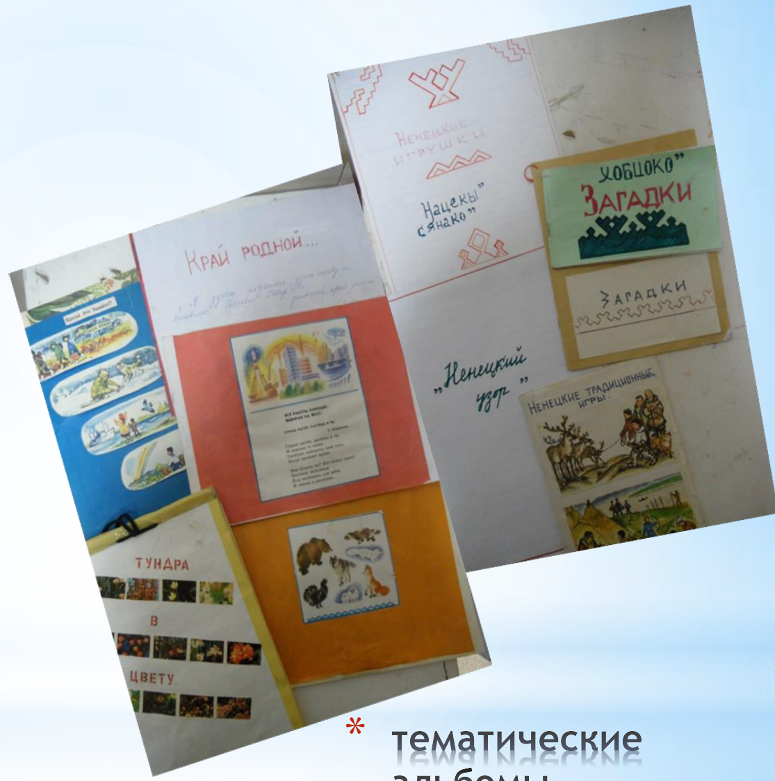
* тематические альбомы